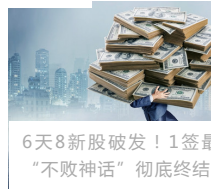
6天8新股破发！1签下“不败神话”彻底终结