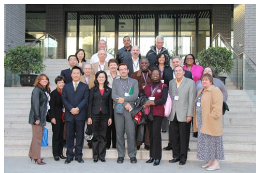
(风险管理与保险学系 陈凯 供稿)

美国人民对人民大使项目隶属于“人民对人民国际组织”。“人民对人民国际组织”是由美国前总统艾森豪威尔将军于1956年，本着全世界各国人民之间应该通过对话和面对面的交流达到相互理解和信任来实现世界和平的目的创立的。美国历届总统均担任过“人民对人民”的名誉主席。现任名誉主席是美国总统奥巴马。艾森豪威尔将军的孙女玛莉·艾森豪威尔是该组织的首席执行官和主席。